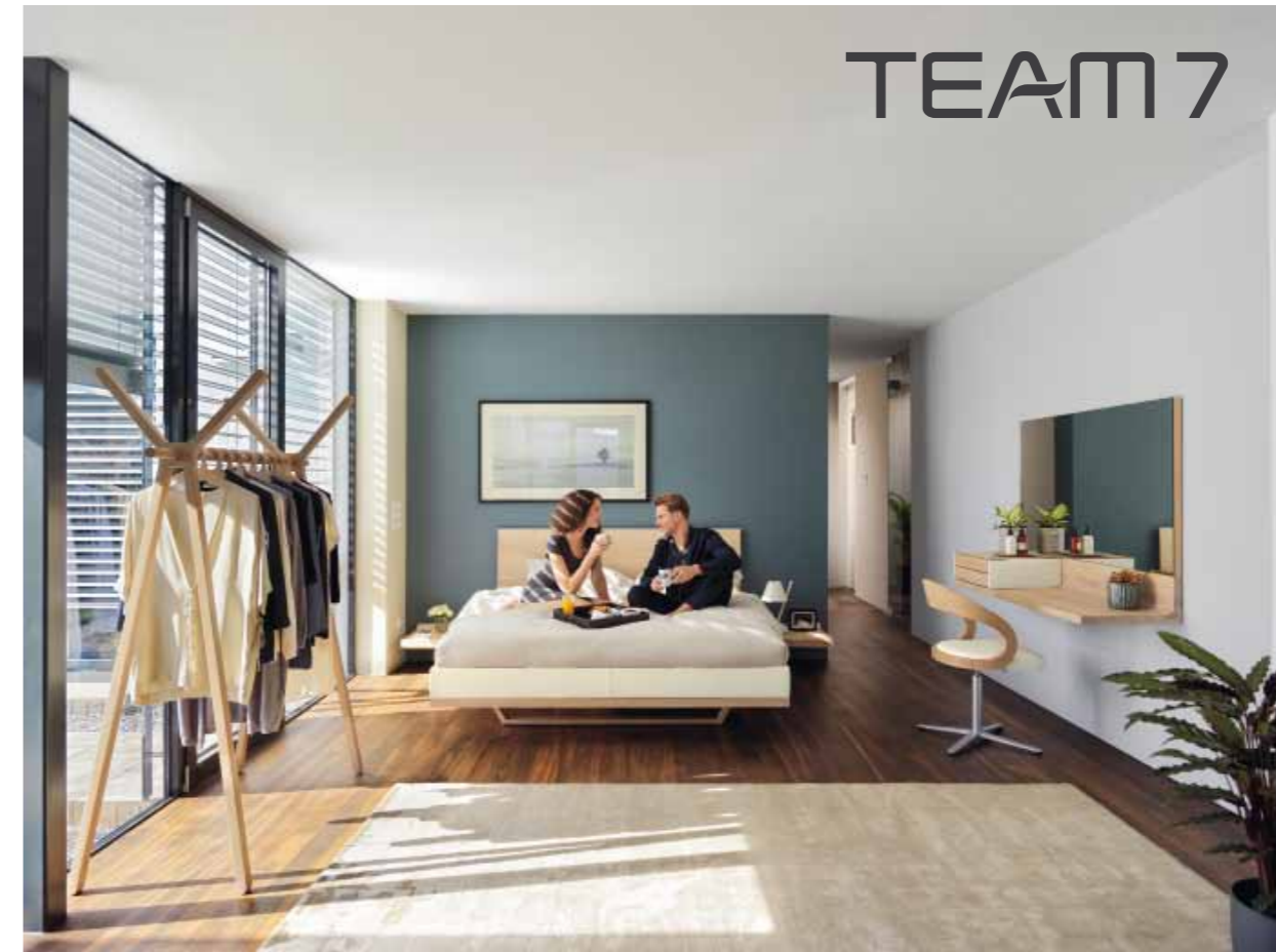
Der neue „SCHLAFEN“-Katalog von TEAM 7 ist eingetroffen...