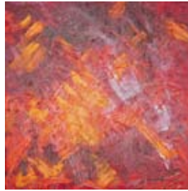
Bild 11/2009 Format: 50 x 50 cm