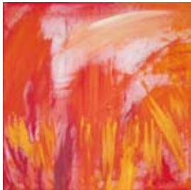
Bild 7/2010 Format: 50 x 50 cm